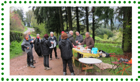
Randonnée pédestre des fours à pain Chaque 1 er mai