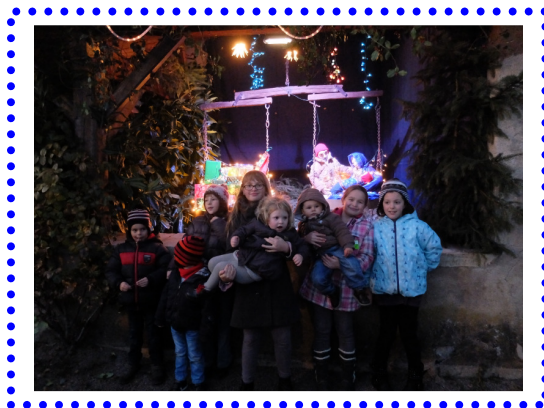
Décembre 2013, lavoir municipal