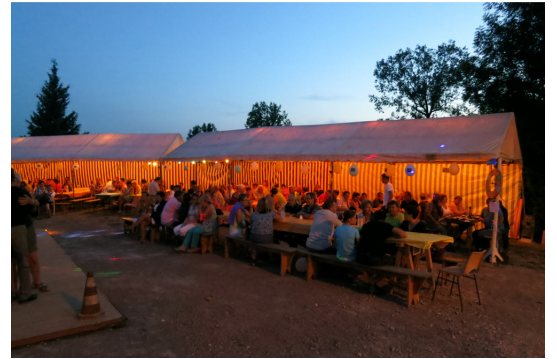
Fête au village : 4 août 2013 jeux, entrecôte charolaise, guinguette....