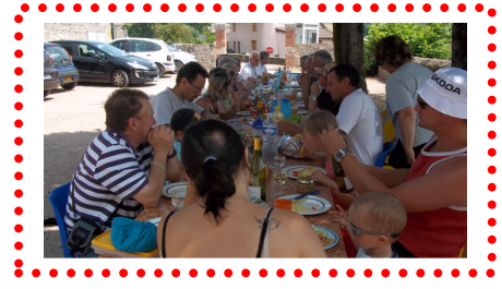
14 juillet 2013 Repas cour de la mairie