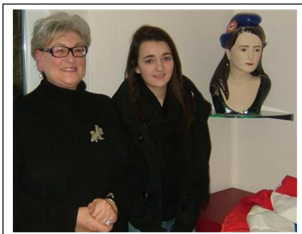
L'artiste, le modèle, l'oeuvre