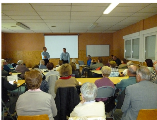
Conférence organisée par la Gendarmerie Nationale auprès de bénéficiaires du CLIC de gérontologie

Le CLIC organise régulièrement des événements (conférences, ateliers, réunions d'information...) très utiles aux personnes âgées et à leurs aidants.