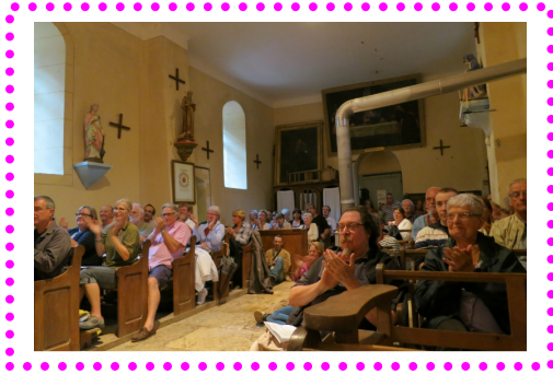
Concert musique baroque, 28 juillet 2013, église