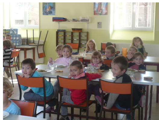
Cantine à Buffières