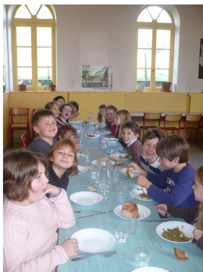
Cantine à Sivignon

Nous tenons à rappeler que si l'Association venait à disparaître, c'est aux municipalités qu'en reviendrait la charge. Nous devons maintenir de notre mieux le fonctionnement actuel, sans quoi nous tomberions dans un système plus "industriel" qui entraînerait une augmentation significative du prix du repas. Nos enfants n'auraient donc plus le plaisir de manger, des entrées et des desserts faits maison, de la viande et des légumes locaux dans une ambiance familiale.