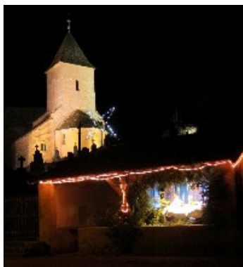
Lavoir décembre 2011

Les objectifs du comité des fêtes ne changent pas : inventer des moments de partage, de rires et de sourires ensemble, habitants et amis du village, de France, d'Europe, de Navarre et du monde, familles, jeunes et anciens.