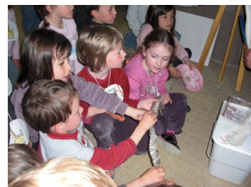
Une journée au zoo avec les élèves de la maternelle