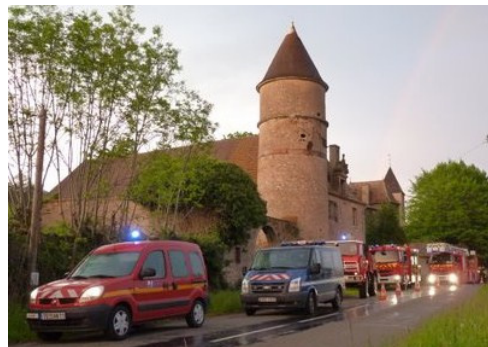
Incendie au château de Curtil 11 mai 2010

Comment s'organise l'intervention des sapeurs pompiers lorsqu'un habitant de Curtil compose le 18 sur son téléphone ?