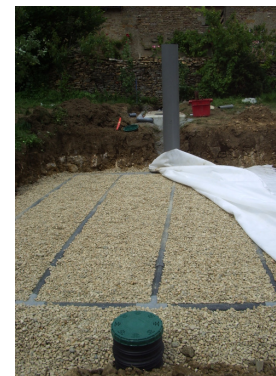
Installation neuve

spancduclunisois@wanadoo.fr Site internet : www.spancduclunisois.fr