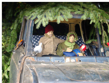
Lavoir de Curtil 2010

La crèche de cette année, se révéla une vraie gageure : entreposer une voiture au lavoir tout en conservant l'ambiance de Noël.