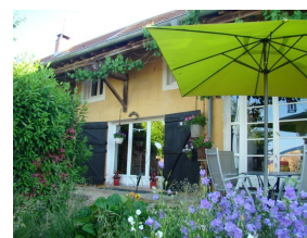
Gîte Baas – Le Champ de la Croix

S'adresser aux propriétaires ou à la fédération des gîtes de France