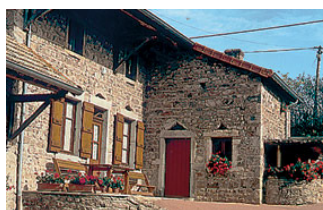
Gîte Bachelet – Le Murot