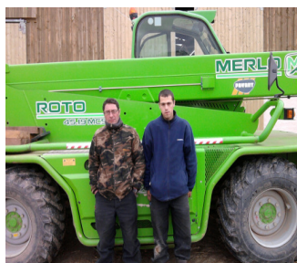
J. M. Laffay & B. Berry Photo SARL Laffay

Bar - Tabac - Snack Epicerie - dépôt de pain Journal de la Saône et Loire Services de proximité (Photocopies, point argent) Fermeture mercredi