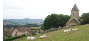
Bovins appartenant à M. Bouchot à proximité de l'église de Curtil

(charpentier depuis le 1991) Charpente couverture zinguerie Neuf – rénovation Bâtiment agricole à Curtil depuis le 01/06/2010 avec création d'un emploi