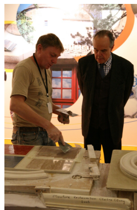
avec Frédéric Mitterrand Ministre de la culture

Michel Fleury, artisan-formateur Le village