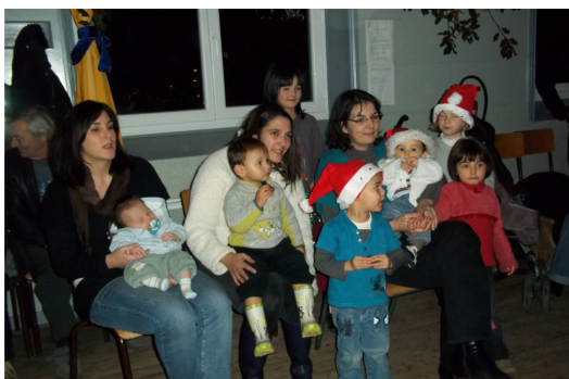
Fête de Noël 2010 photo comité des fêtes