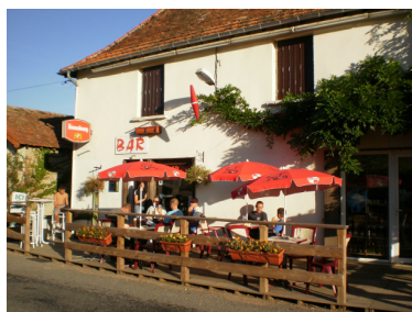
Café épicerie tabac « Le Curtil »