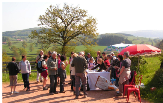
1 er ravitaillement sur Trivy