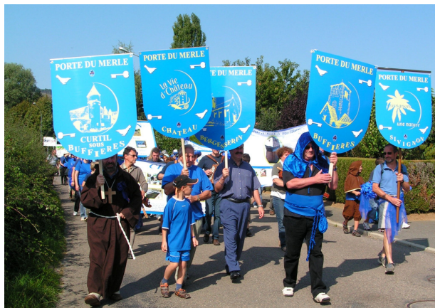
Les communes de la porte du merle (Bergesserin, Buffières, Château, Curtil & Sivignon), à la couleur bleue, avec étendards et bannières partent à l'assaut de Cluny

Le 13 septembre 2009, lancement des festivités de Cluny 2010 avec participation des communes du clunisois.