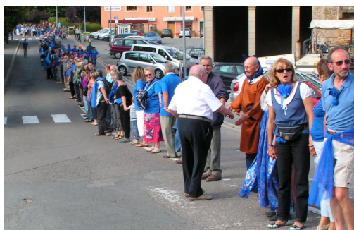
Maillons de la chaîne humaine sur les anciens remparts de Cluny

Retrouver les communes de la Porte du Merle sur internet :