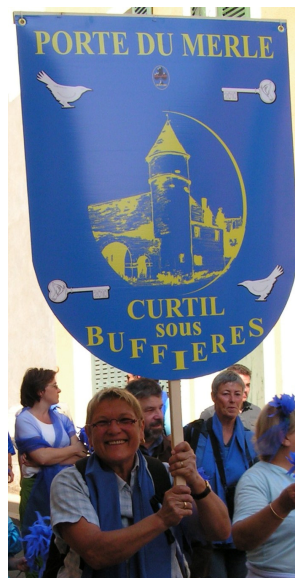
Etendard fièrement porté par une curtijotte

Le 13 septembre 2009, lancement des festivités de Cluny 2010 avec participation des communes du clunisois.