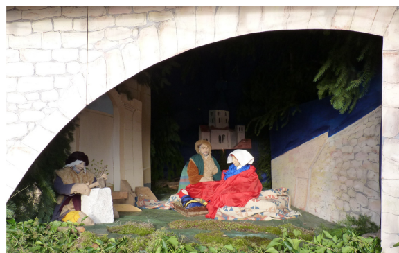
Lavoir communal transformé en crèche Noël 2009 Sur fond de construction de l'abbaye de Cluny