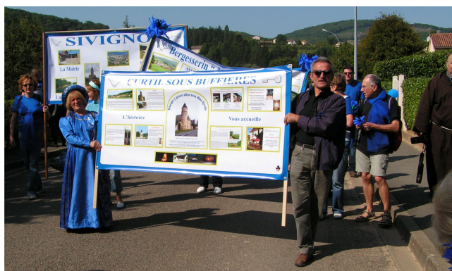
manifestation dans nos campagnes ?!