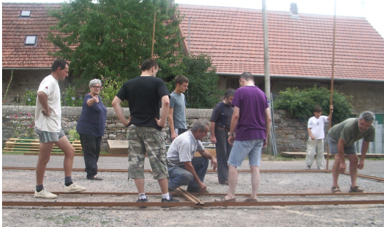
Les préparatifs, un travail d'équipe où la réflexion est toujours reine