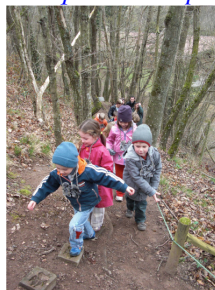
A la queue le loup...