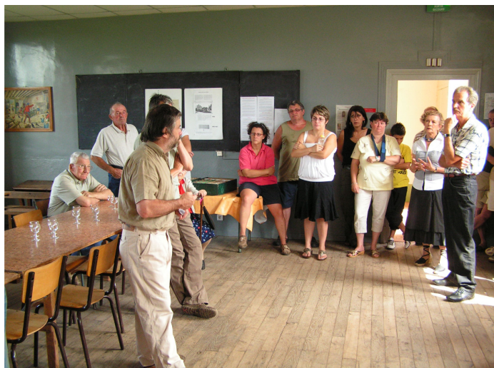
14 juillet 2009

La vie municipale d'une commune rurale atteignant à peine 80 habitants permanents, confinée dans une ruralité bucolique, semble, à priori, éloignée des turbulences médiatisées comme la réforme des collectivités territoriales ou celle de la taxe professionnelle, voire même de la crise mondiale. Cependant les difficultés ne nous épargnent pas pour autant.