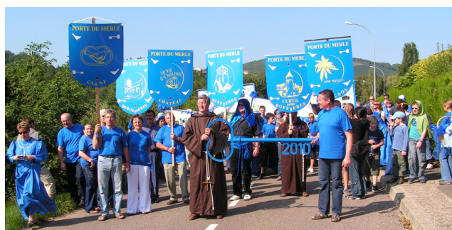
Remise de la clef de la porte du merle