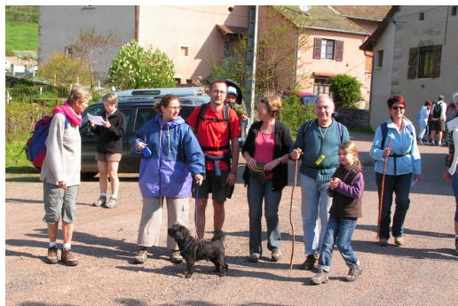
Départ d'un groupe de marcheurs