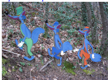
A pas de loup...