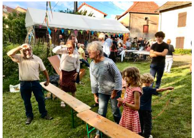
La fête de l'entrecote le 1 er août Place des Jandots.