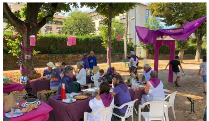
Tous en violet pour les 1111 ans de l'Abbaye de Cluny.