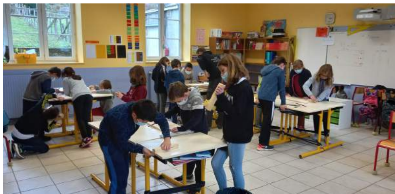
Atelier Rolla-Bolla à l'école de Sivignon