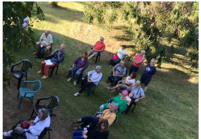
Conclusion musicale de la première édition de lecture buissonnière au Moulin.