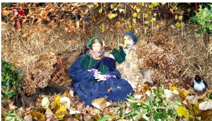
La décoration du lavoir de Noël 2021.