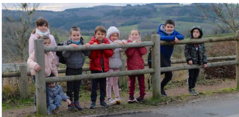
Les jeunes curtiageots scolarisés au RPI cette année.

Les Loustics remercient tous les parents d'élèves, les enseignants et personnel scolaire qui contribuent chacun au succès de tous ces événements pour nos enfants !